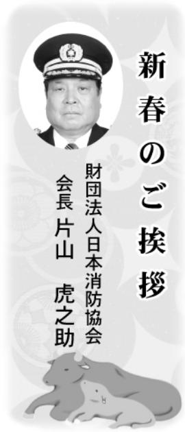
財団法人日本消防協会