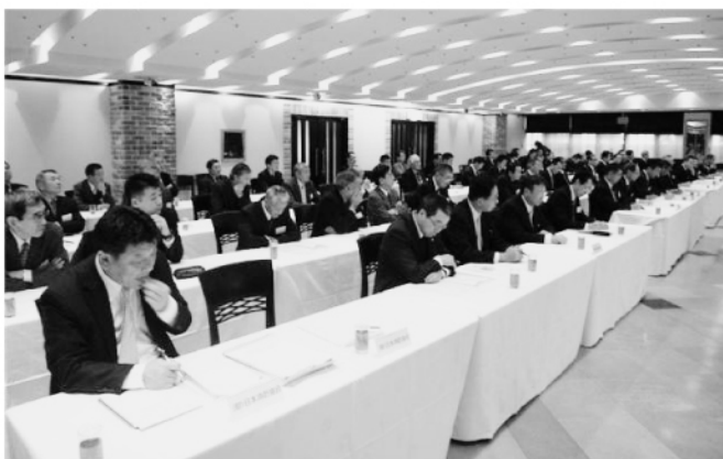
全 体 研 修