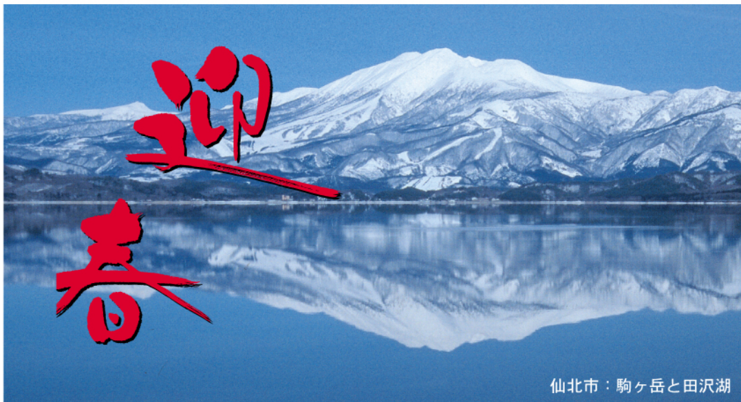
仙北市：駒ヶ岳と田沢湖