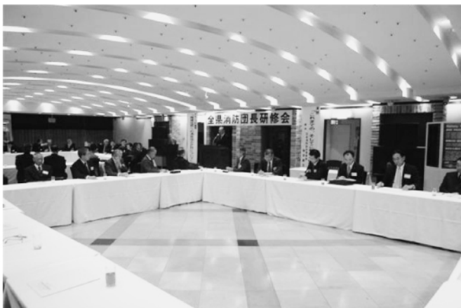
グ ル ー プ 研 修

張り付けて業務を行う、「パートナー制度」が活動の円滑化に極めて有効であることや、増員確保の決め手は、一対一の関係で入団が決まるという実態を、また主課題である地域住民への消防団のPRについて、広報では、関係する多くの人に理解・協力してもらいながら行うことの重要性を、また、PR全般では、地道にできることから実践してゆくことの大切さなどが意見として出され、今後、それぞれの消防団が自らの地域での取り組みを確認した。 初めての消防団長研修会であったが、参加者の熱心な会議への取り組み、日本消防協会の支援で有意義な研修会となった。秋田県消防協会は、今後も、いろいろな工夫をこらしながら、この研修会を実施したいと考えている。