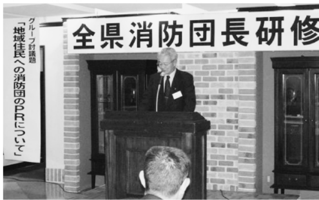
開 会 式

秋田県消防協会の本年度の新規事業の一つである「全県消防団長研修会」が、十二月二日(火)秋田市で開催され、県内消防団長ら約六十名が参加して、消防をめぐる諸問題の研究討議が熱心に行われた。この研修会は、自然災害の発生、災害や事故の複雑化・多様化、消防の広域化など地域消防が大きく変革するなかで、全県の消防団長が一堂に会した研修によって消防団運営の活性化に貢献して頂くため、日本消防協会の出前講座を活用して開催。